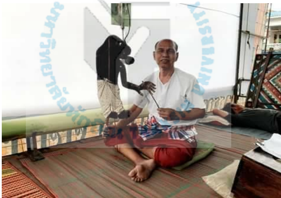
ภาพที่ 12 หนังวรรณ เชียงทอง