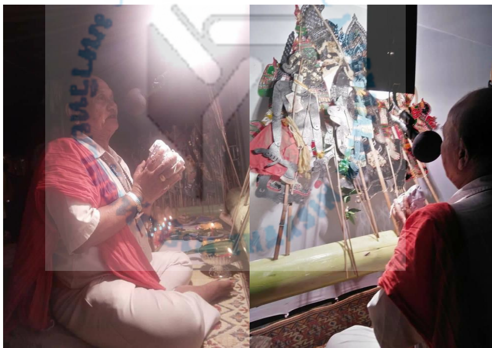
ภาพที่ 2 นางเคล้าน้อย โรจนเมธากุล (ศิลปินแห่งชาติ) ทำพิธีกรรมการแก้สินบนหนังตะลุง