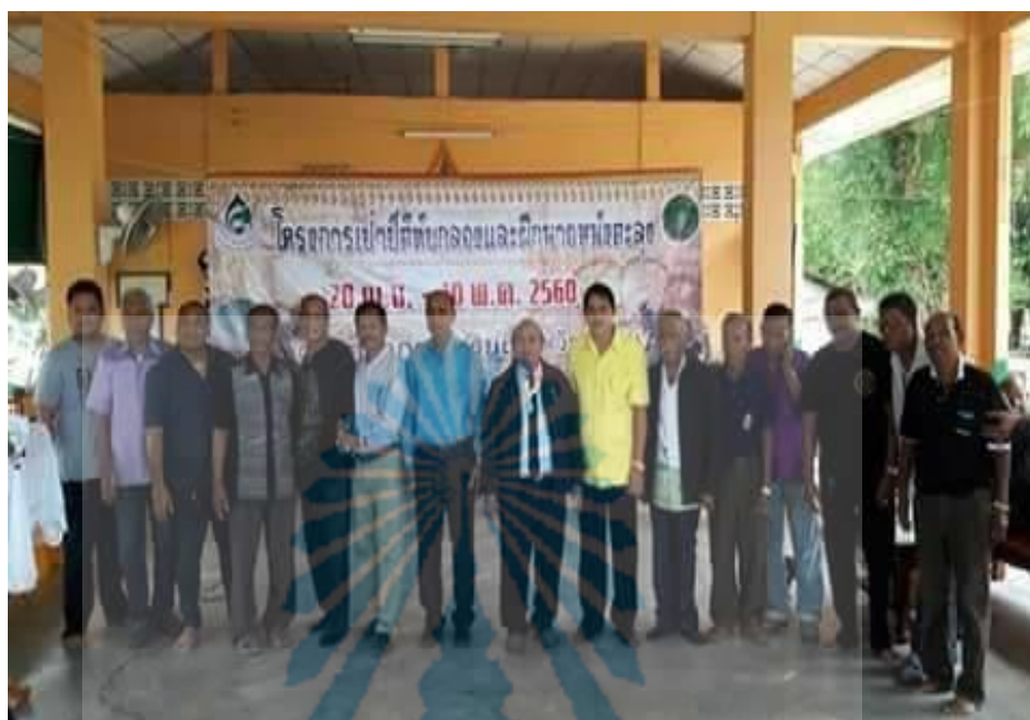
ภาพที่ 6 หนังสือเล็กน้อย โจรินเมธากุล (ศิลปินแห่งชาติ) และคณะลูกศิษย์ ร่วมโครงการเป่าปี่ดี ทับกลอง และฝีกนายหนังตะลุง (ที่มา : ปรินทร์ รัตนบุรี. ถ่ายเมื่อวันที่ 20 เมษายน 2560)