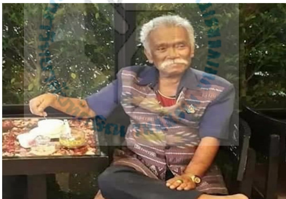
ภาพที่ 7 หนังสือปฐม อ้ายลูกหมี่ (ที่มา : ปรินทร์ รัตนบุรี. ถ่ายเมื่อวันที่ 10 กันยายน 2560)