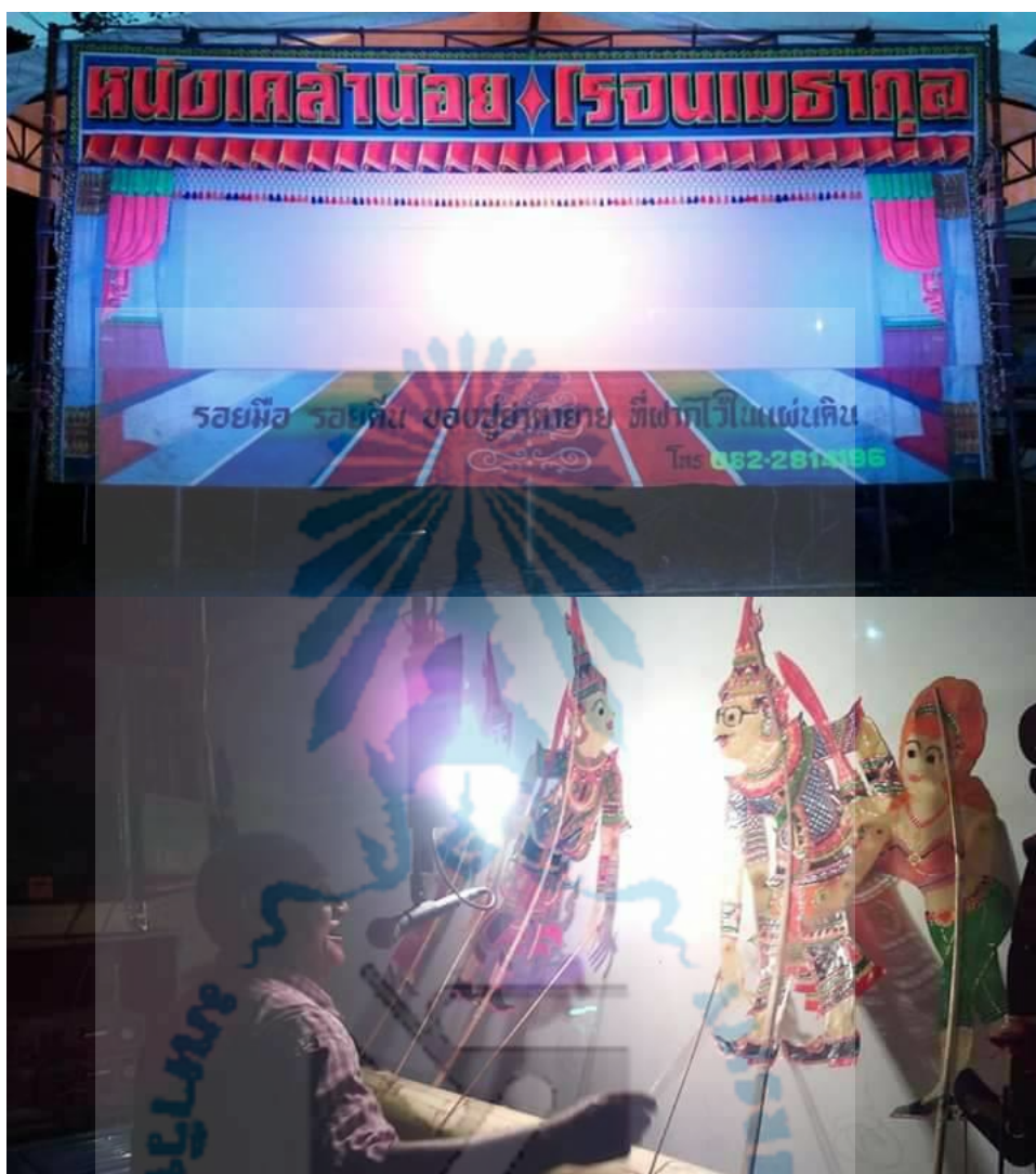
ภาพที่ 3 หนังเคล้าน้อย โรจนเมธากุล (ศิลปินแห่งชาติ) แสดงหนังตะลุง (ที่มา : ปรินทร์ รัตนบุรี. ถ่ายเมื่อวันที่ 14 เมษายน 2559)