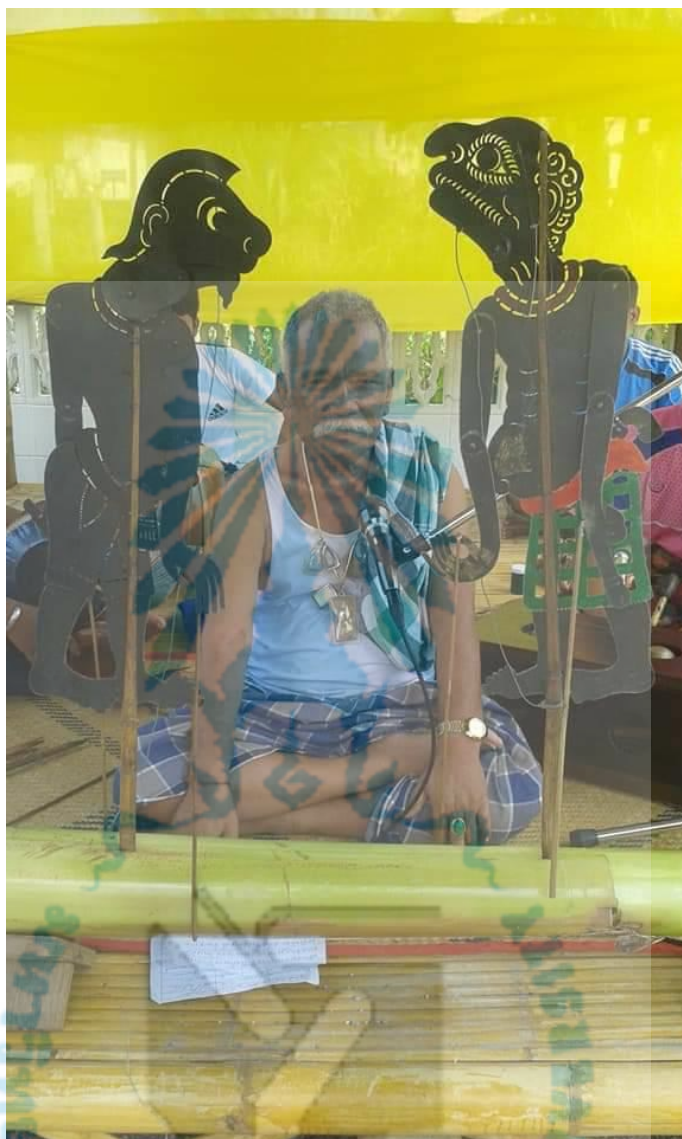
ภาพที่ 8 หน้งปฐุม อ้ายลูกหมี แสดงเปิดโครงการเป่าปี่ ดิทั้บกลอง และฝีกนายหน้งตะลุง