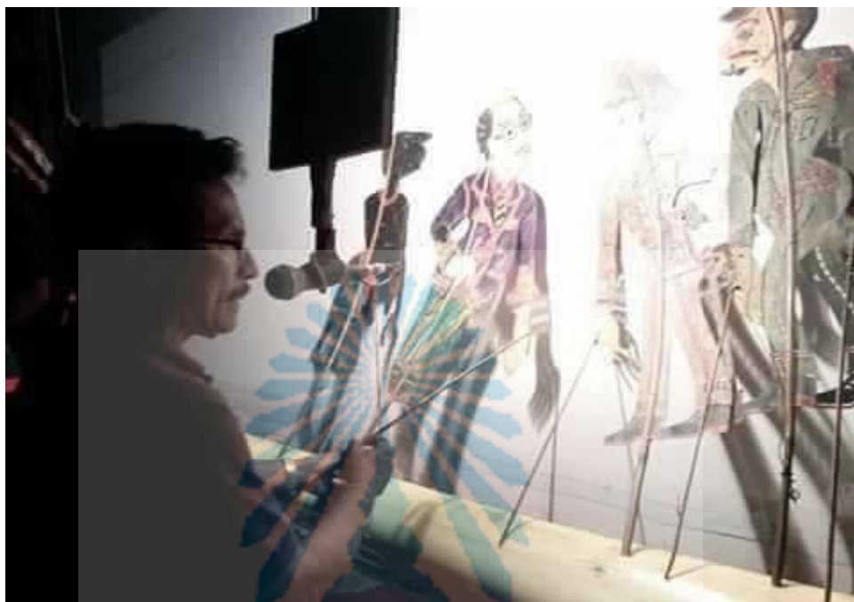
ภาพที่ 11 หนังวีระ ลูกทุ่งบันเทิง (ศ.เกล้าน้อย)